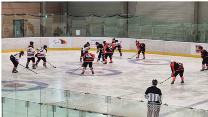
Für die Eishockey-Herren des SCC (hier in einer Partie aus der Vorsaison) geht der Spielbetrieb bald los

Die Eishockey-Herren des SCC Berlin starten am 9. Oktober mit einem „Auswärtsspiel“ bei den Berlin Blues in die neue Saison. Los geht es um 13 Uhr im Paul-Heyse Eisstadion. Für die Charlottenburger ist das gleich ein dicker Brocken. Die Blues setzten kürzlich mit einem Testspiel-Sieg gegen den Vorjahresmeister, die Allstars von Fass Berlin, ein starkes Ausrufezeichen.