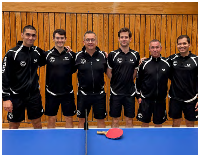
Die 1. Herren starten in die Saison

Am 11. Oktober laden wir aber erst einmal zur diesjährigen Hauptversammlung der Abteilung ein. Et was später im Oktober schließen wir dann ein besonderes Projekt ab. Welches? Das zeigen wir euch am besten, wenn es fertig ist.