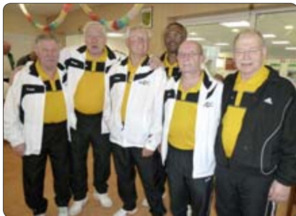
Die 2. Mannschaft schaffte den Klassenerhalt