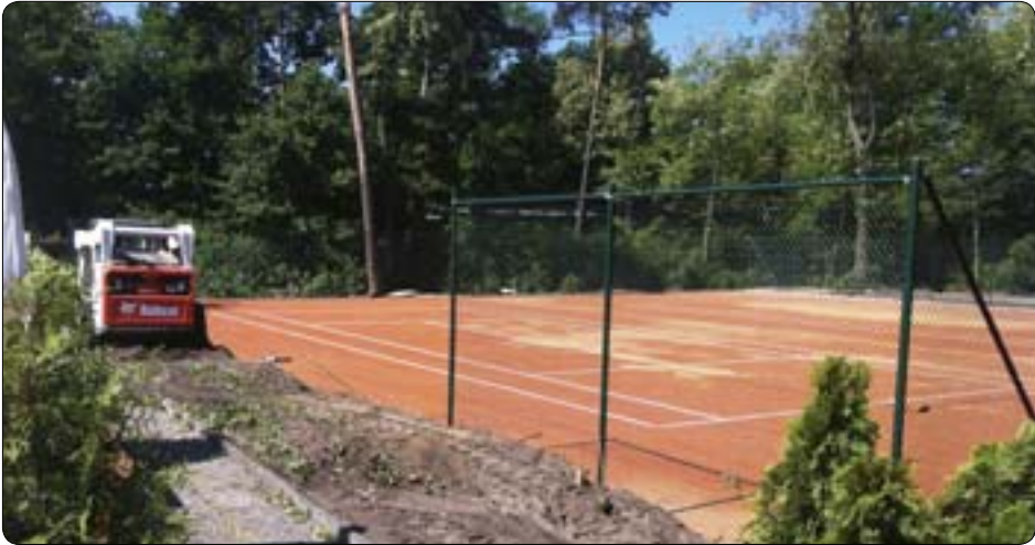
Zwei neue Turniersandplätze im SCC

Ein großes Dankeschön an die McPaper AG für die großzügige Unterstützung und an die Firma Schönfeld Tennis-Service für ihren teilweise nächtlichen Einsatz in den vergangenen Wochen.