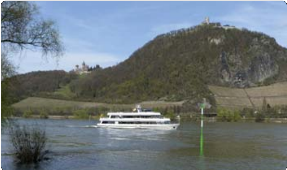
Blick auf den Drachenfels.

Am 10.06.2013 spazierten wir zur nahe gelegenen ältesten Zahnradbahn Deutschlands und fuhren auf den Drachenfels. Dichter Nebel versperrte uns jedoch die Aussicht auf den Rhein. Die Abfahrt vom 321 Meter hohen Felsen führte uns zurück nach Königswinter am Schloss Drachenfels vorbei. In der Nähe des Hotels bestiegen wir dann die „MS Theresia“ und machten eine herrliche zweistündige Schiffsfahrt rheinaufwärts. Es ging vorbei am Adenauer-Haus in Rhöndorf, dem jahrelangen Domizil der Familie Adenauer und der letzten Ruhestätte von Konrad Adenauer. Wir sahen das Schloss Marienfels bei Remagen, welches von 2004 bis 2013 im Besitz des Entertainers Thomas Gottschalk war und die Pfeiler der durch den Krieg bekannten Brücke von Remagen, in denen jetzt ein Museum untergebracht ist. Ziel war das hübsche Städtchen Linz mit seinen vielen Sehenswürdigkeiten: Pfarrkirche St. Martin, Burgplatz und Marktplatz mit dem Denkmal der Marktfrau. Auf der Rückfahrt wurde ein Stopp auf dem Petersberg eingelegt. Er hatte für die deutsche Nachkriegsgeschichte