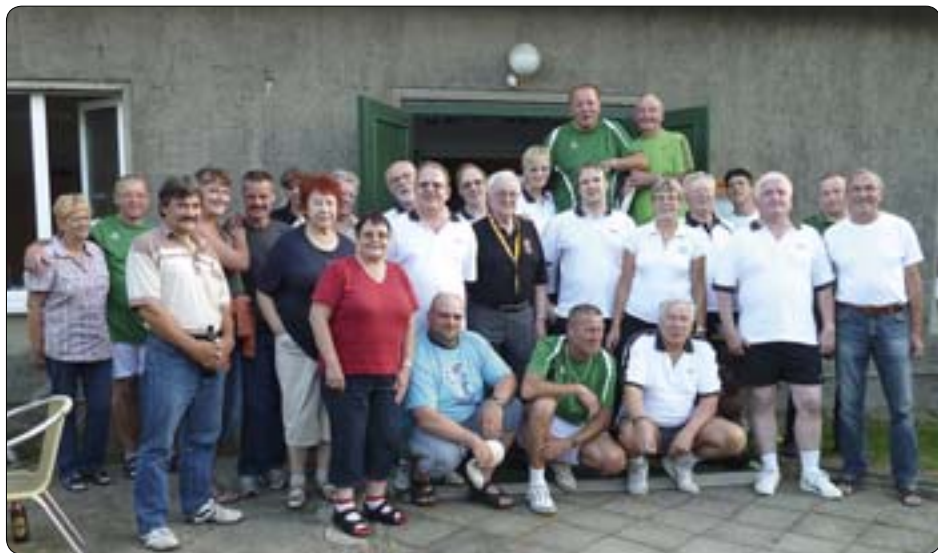
Böhlener und Berliner