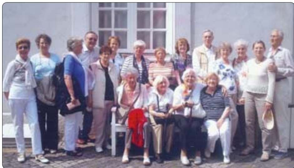
Gruppenfoto der Seniorenschaft, die auf der Reise nach Königswinter dabei war.